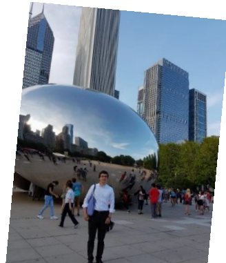
“Cloud Gate” des britischen Künstlers Anish Kapoor im Millennium Park von Chicago – und im Hintergrund das Baker McKenzie Büro