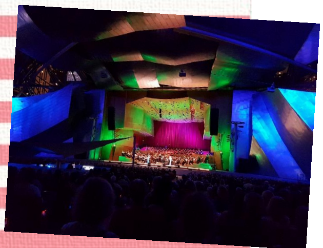
Vorführung des Musicals „Wicked“, eines der Sommerkonzerte im Jay Pritzker Pavilion, Millennium Park